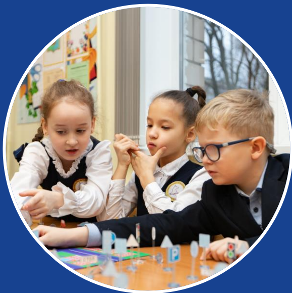
Дошкольники и младшие школьники, 5-9 лет

Активности разработаны с учетом особенностей восприятия информации каждой возрастной группой, что позволяет достичь наилучшего результата