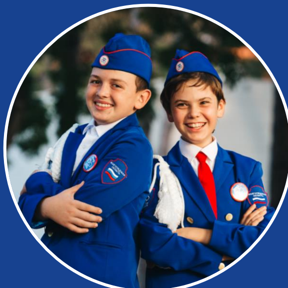
Средняя школа, 10-14 лет