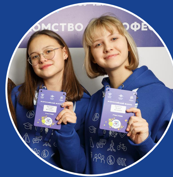
Старшие классы 15-17 лет