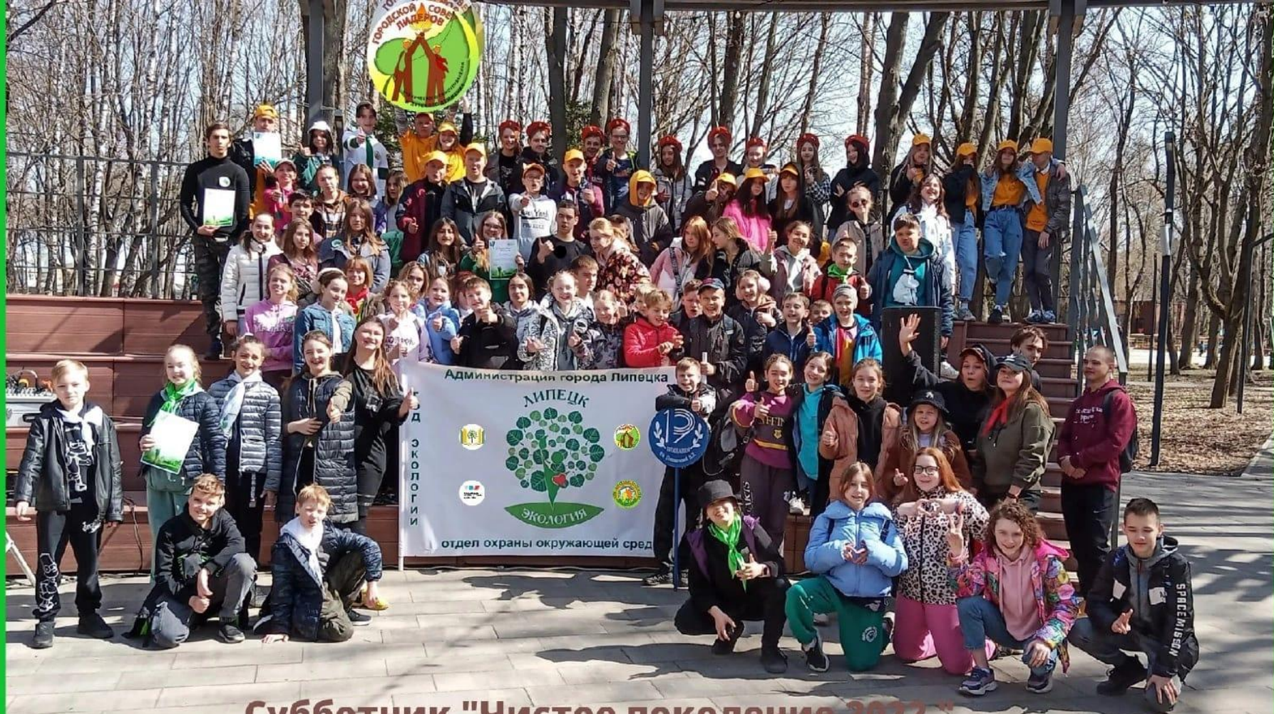
Субботник "Чистое поколение 2022".