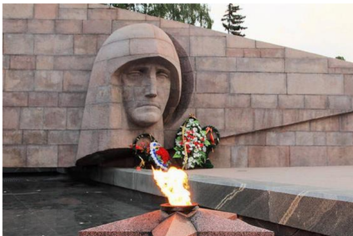
Памятник «Скорбящей матери-Родине». Самара. Открыт в 1971 г.