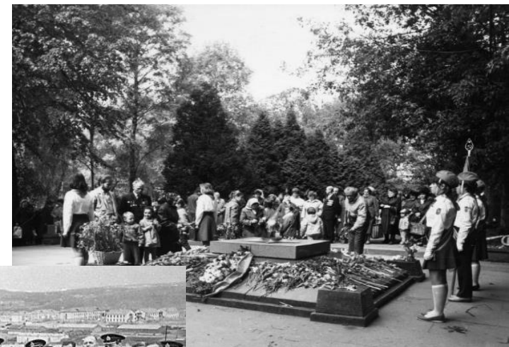
Вечный огонь у военного мемориала на Преображенском кладбище, Москва.