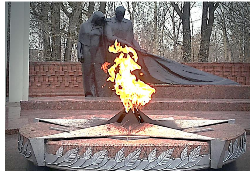
Мемориал «Вечный огонь». Тюмень. Открыт в 1968 г.