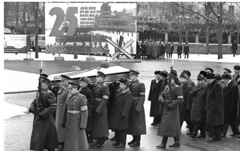
Захоронение у Кремлёвской стены останков Неизвестного солдата. 3 декабря 1966 г.