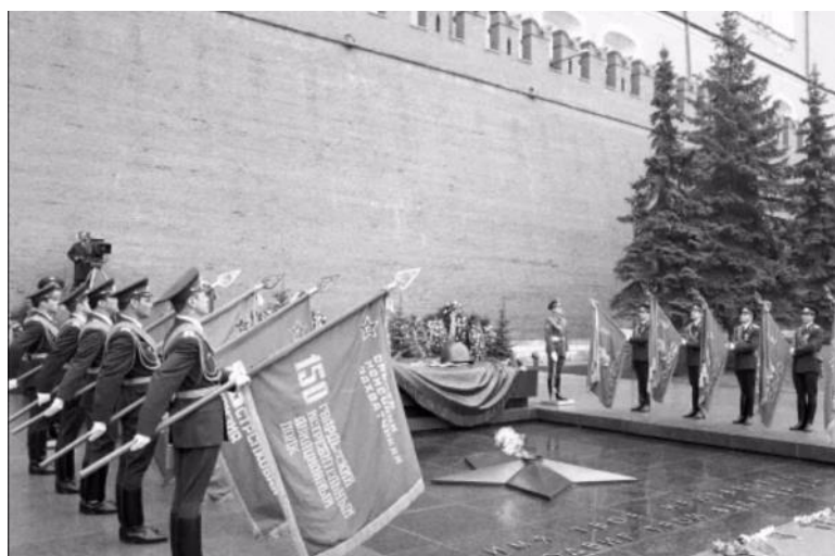
Торжественное открытие мемориала Неизвестному солдату, 8 мая 1967 г.