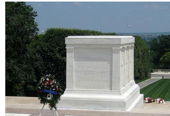
Штат Вирджиния, США