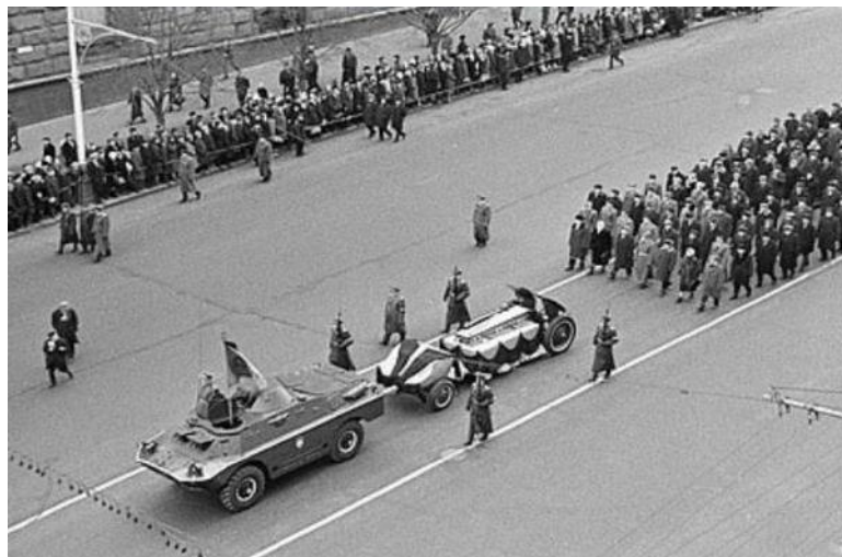
Траурная процессия на Тверской ул. Москвы. 3 декабря 1966 г.

8 мая 1967 года состоялось торжественное открытие мемориала.