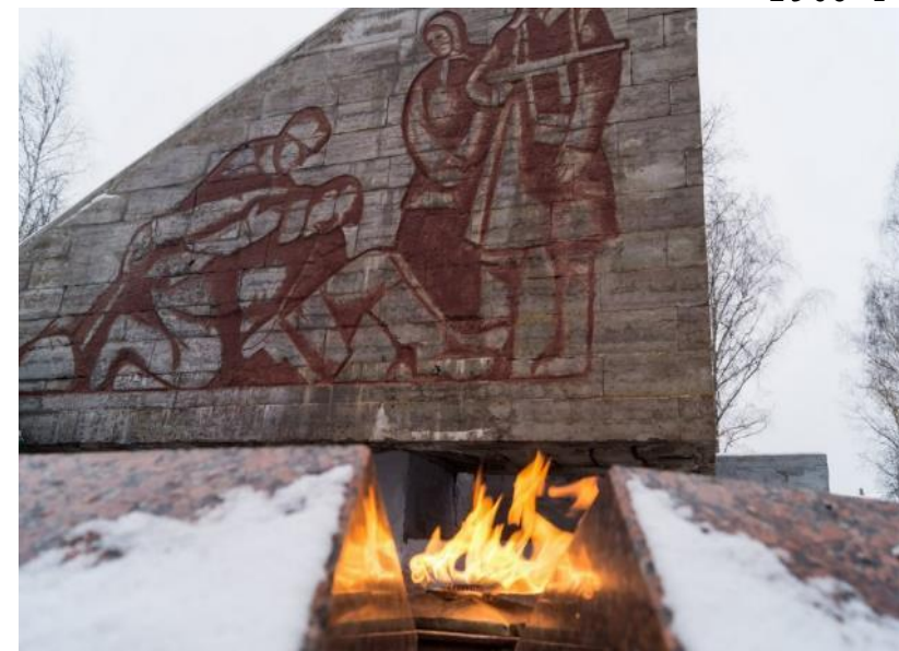
Мемориал «Славы» в Старой Руссе. Новгородская обл. Открыт в 1964 г.