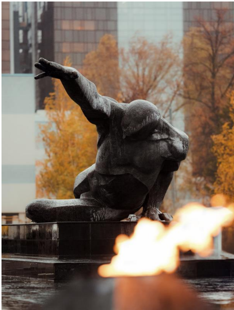
Памятник «Неизвестному солдату». Казань. Открыт в 1967г.