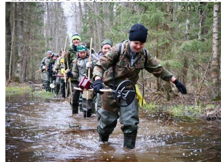
Экспедиции Поискового движения России