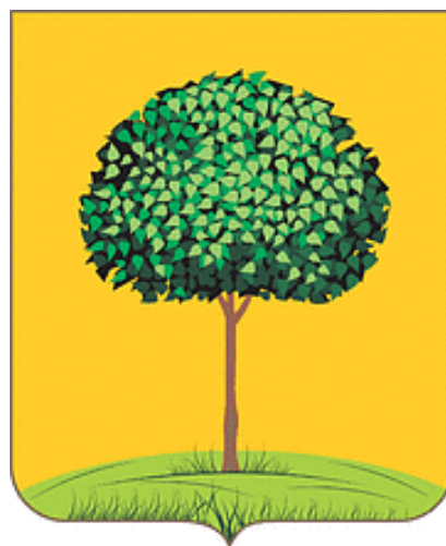
герб г. Липецк