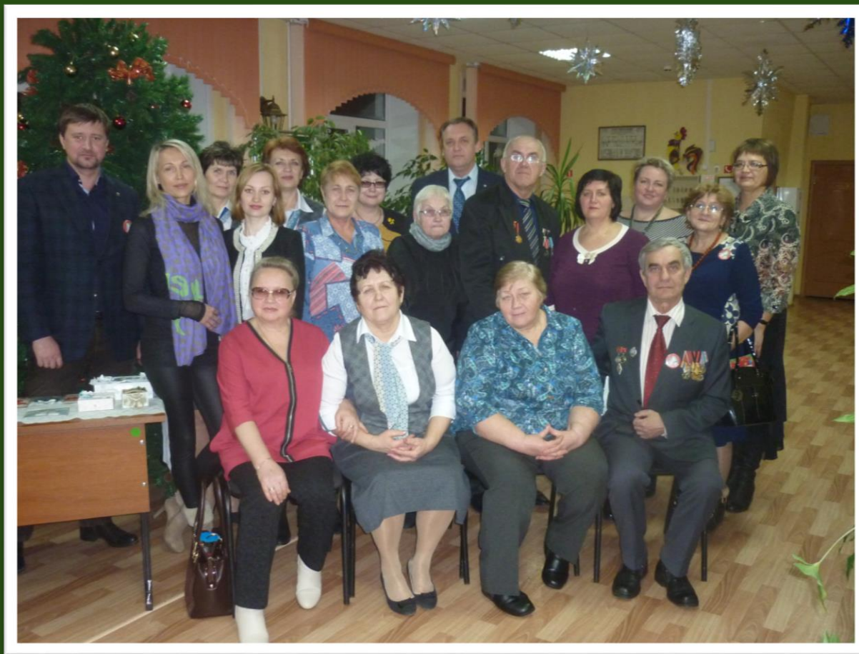
Социально-педагогические партнёры в ЭЦ «ЭкоСфера» г. Липецка