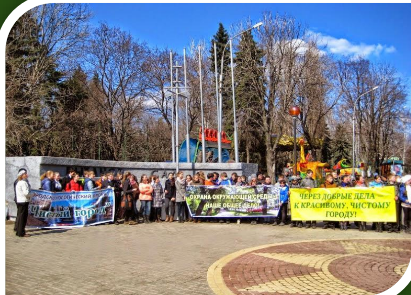
Открытие городского проекта «Чистый город»