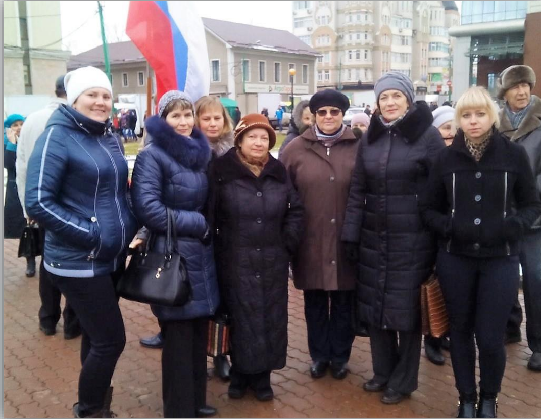
Участие в демонстрациях