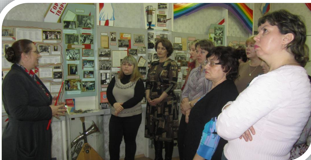
Поездка в заповедник «Галичья гора»