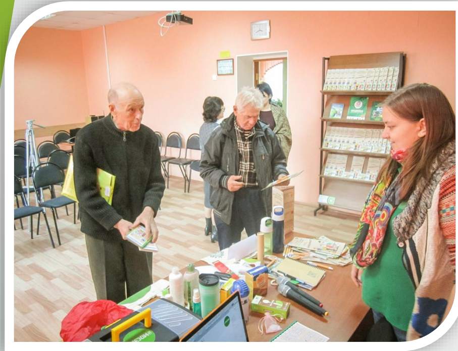
Участие в семинаре «Эко возраст»