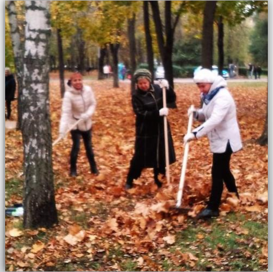
Участие в субботниках